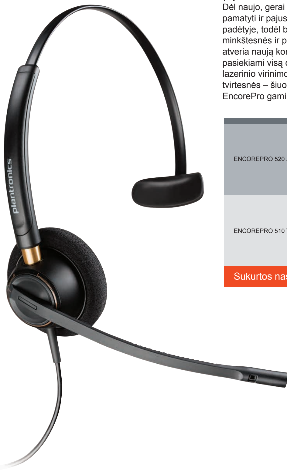
ENCOREPRO 520 ABIEMS AUSIMS

Dėl naujo, gerai apgalvoto dizaino lengva pamatyti ir pajusti, ar mikrofonas yra tinkamoje padėtyje, todėl būsite dar geriau girdimi. Dar minkštesnės ir prabangesnės ausų pagalvėlės atveria naują komforto lygį tiems, kurie turi būti pasiekiami visą dieną, kasdieną. Dėl panaudoto lazerinio virinimo ir aviacinio aliuminio ausinės dar tvirtesnės – šiuo metu tai patvariausias EncorePro gaminys.